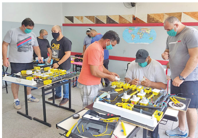
Alguns dos alunos já tinham noção de serviços elétricos

O programa realizado em novembro foi praticamente destinado às instalações residenciais, já o outro previsto para Boa Esperança vai envolver os participantes em instalações industriais, daí ser a grade voltada para alta tensão.