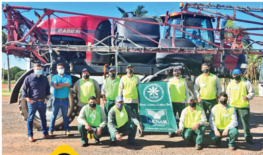
Participantes do curso realizado na Fazenda Entre Rios da Citrosuco

Nas propriedades rurais é comum encontrar muitos tratores agrícolas, porém o número de pessoas aptas e adequadamente capacitadas é pequeno, por isso, um operador treinado faz toda a diferença para um bom