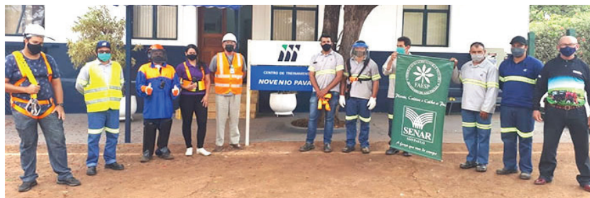
Instrutor e alunos juntos no encerramento do curso na São Martinho

Por conta dos perigos eminentes é que o Senar busca prevenir o crescente número de acidentes; com isso as empresas cada vez mais investem na capacitação, oferecendo gratuitamente, um curso sobre o tema.