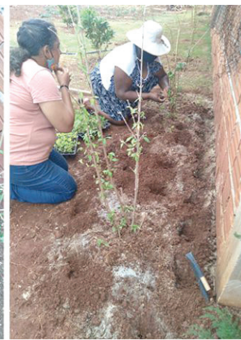
Toda preparação da terra para o plantio das flores