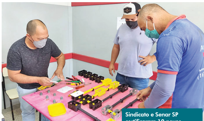
Sindicato e Senar SP certificaram 10 novos profissionais para o mercado de trabalho