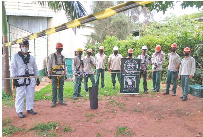
Equipe participante do programa na Fazenda Maringá