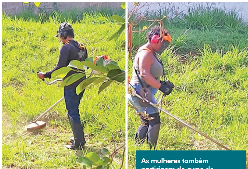
As mulheres também participam do curso de roçadeira buscando ampliar a renda familiar com o trabalho