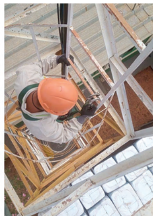
Trabalho em altura exige muita concentração