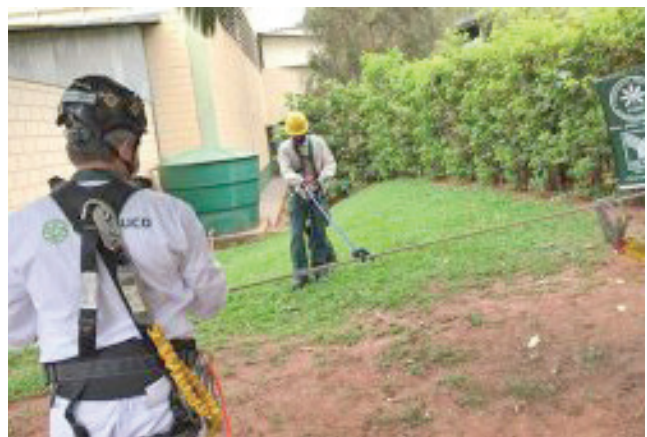
Aula teórica dada aos trabalhadores