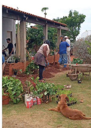
Produtores querem dar continuidade ao aprendizado para transformar a propriedade numa fonte de renda familiar