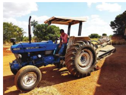
A familiarização com o trator