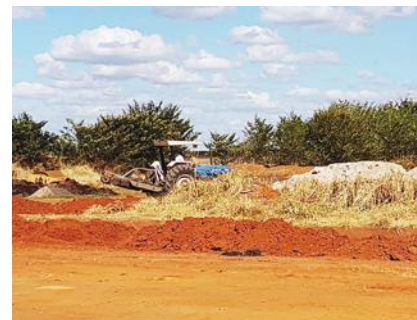
O trabalho em meio ao laranja