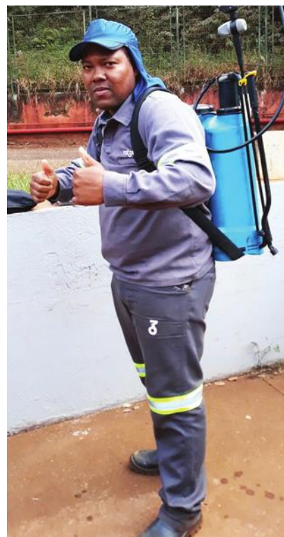
Segurança com o uso dos EPIs

com os trabalhadores e também o meio ambiente: “A interação entre todos é de extrema necessidade e se cada um fizer sua parte, teremos um mundo melhor, construído com responsabilidade”, assegura o coordenador.