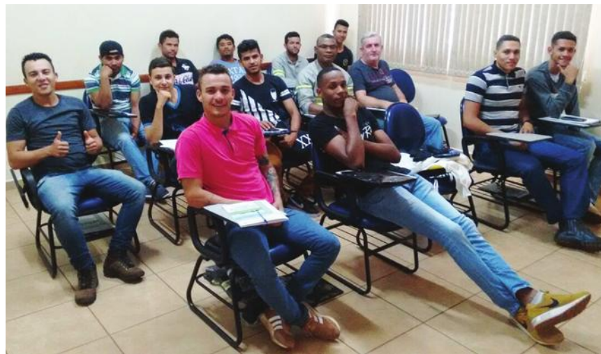
Participantes do curso sobre pulverização de agrotóxicos