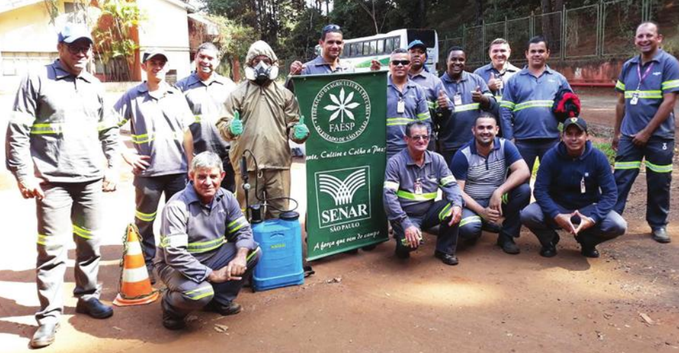
Formandos em mais um curso de capacitação na antiga Usina Zanin (Raízen)