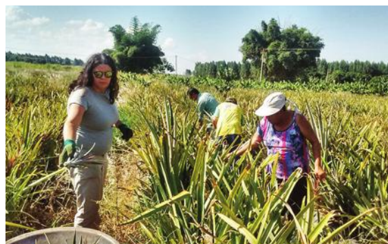
As aulas práticas propiciam a aprendizagem concreta, pois esclarecem várias dúvidas, como tirar mudas para replantar