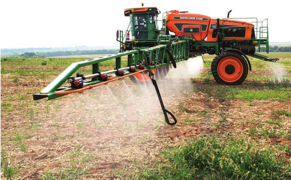
Trabalho na lavoura, realizado com pulverizador de barras