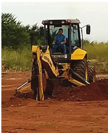
Aula prática em área do município

Após a realização do curso, os próprios participantes além de elogiarem os treinamentos, disseram que a partir de agora vão se sentir muito mais seguros. Isso é importante para que o profissional se sinta valorizado e o município ganhe com isso. Ao mesmo tempo, trata-se de uma ação social de grande importância.