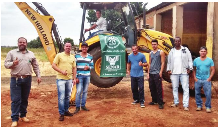
Almoxarifado da Prefeitura em Américo onde parte do curso foi realizada