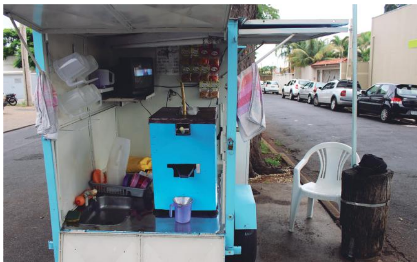
Visão geral da banquinha instalada próxima ao Teatro Municipal