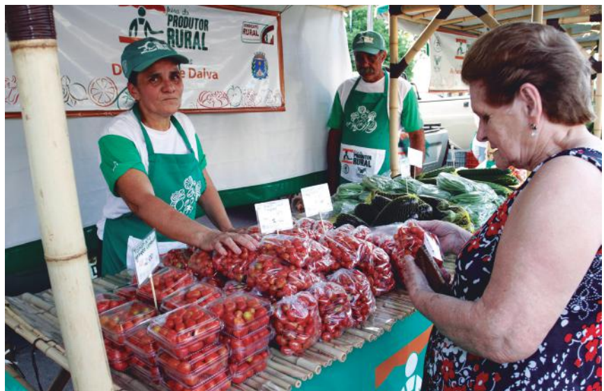
A feira na Vila Ferroviária comercializa produtos da mais alta qualidade