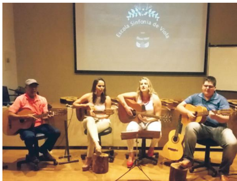
Recital da Escola Sinfonia da Música no Sindicato Rural

Para ela, na foto abaixo, um orgulho estar ao lado do pai durante o recital