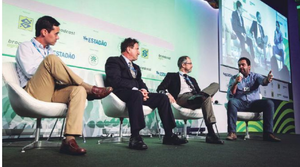
Um dos painéis do Summit Agronegócio no Estadão

“O mundo está vivendo um dilúvio de informações na agricultura e é importante agora, selecionar os dados mais relevantes e aplicá-los contribuindo com os avanços e ter em troca aumento de produtividade