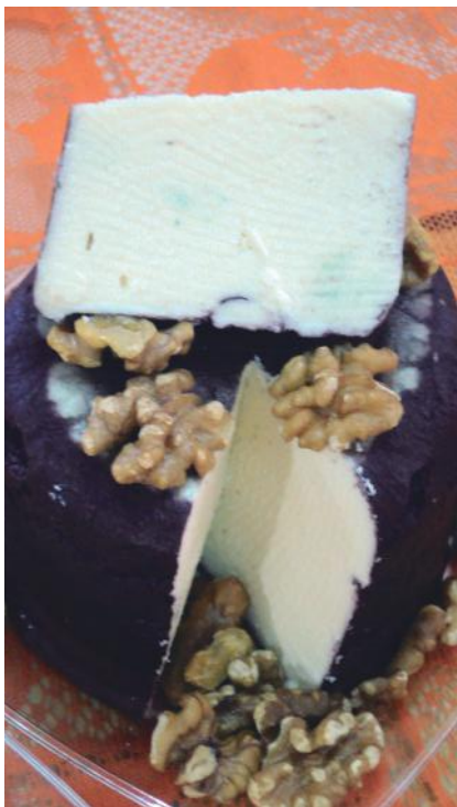
Queijos curados com damasco e nozes