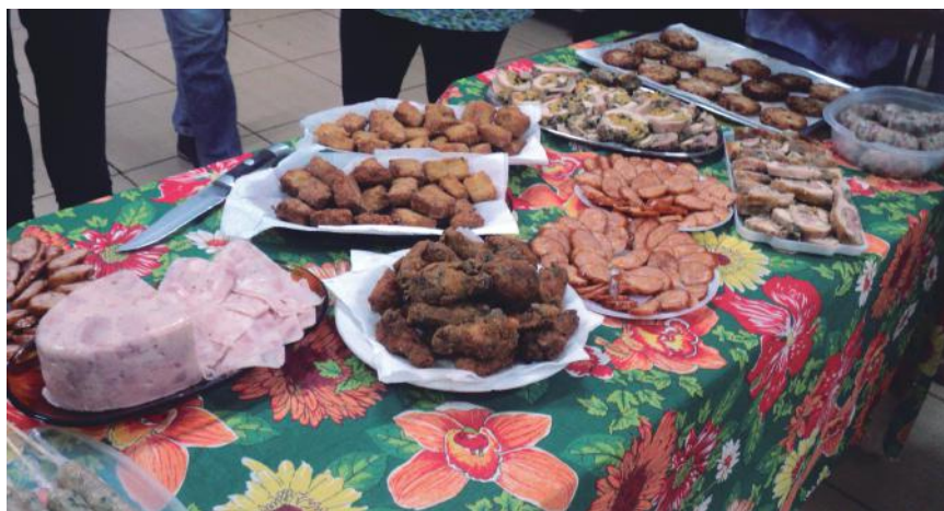
Encerramento do curso e exposição dos produtos