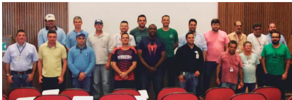
No auditório da Canasol foram realizadas as aulas teóricas

manifestou sua opinião, tecendo elogios ao trabalho que o órgão vem desenvolvendo em parceria com o Sindicato Rural.