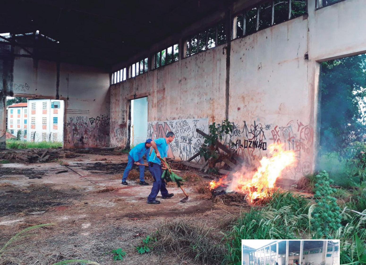
Mobilização dos participantes durante a realização do curso