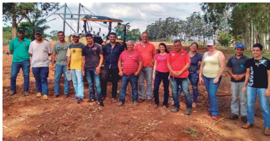
Participantes do mesmo curso (aplicação de agrotóxicos com pulverizador de barras) no sítio da Uniara em Araraquara