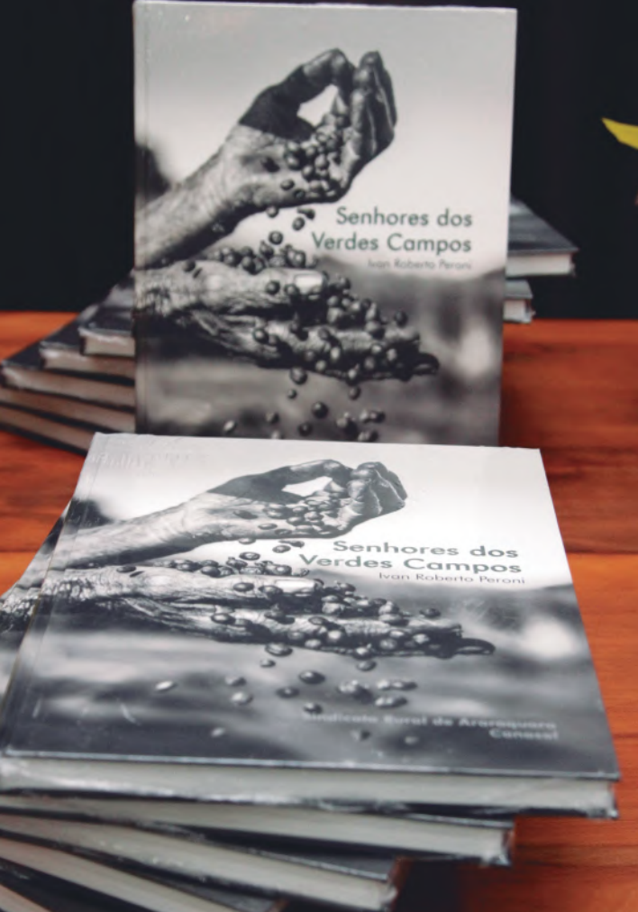
A foto que ilustra a capa é de autoria de Vilson Palaro Jr., primeiro lugar na VIII Biennale Internazionale D'Arte Contemporânea de Firenze (Itália), em dezembro de 2011