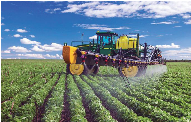
O pulverizador 4730 da John Dere foi levado ao público brasileiro antes mesmo que nos Estados Unidos, país sede da marca; ele utiliza uma barra de sustentação feita de carbono que pesa 350 kg a menos que os tradicionais. A tecnologia, que foi trazida dos veículos da Fórmula 1, promete reduzir em 8% os custos com combustíveis e também menor compactação do solo.

Quem está no campo já sabe, porém, para os leigos no assunto é bom dizer que a aplicação de agrotóxicos pode ser feita com pulverizador de barras ou então costal como mostram as imagens. Em ambas há o ensinamento do SENAR