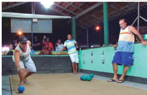
Pela primeira vez em Araraquara, o SENAR e o Sindicato Rural organizam um Torneio de Bochas para promoção do companheirismo entre os trabalhadores rurais

Pensando e agindo desta forma é que a coordenadoria do SENAR em Araraquara após inúmeros estudos, criou uma grade de cursos para 2018, incluindo algumas novidades como atividades de lazer que têm por objetivo despertar a amizade e o companheirismo entre os pequenos produtores.