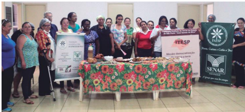
Momento de confraternização entre os alunos

Nos dias 28, 29 e 30 de novembro ocorreu a atividade Processamento Artesanal de Carne de Aves. Os participantes aprenderam o processo completo de produção artesanal desde a desossa e separação dos cortes, até a produção de linguiças, cudigüim, rocambole, frango defumado, empanados, dentre diversos outros produtos. Além disso, eles tiveram a oportunidade de receber orientações sobre a montagem do defumador artesanal, que possibilita diversificar os produtos provenientes das carnes de aves.