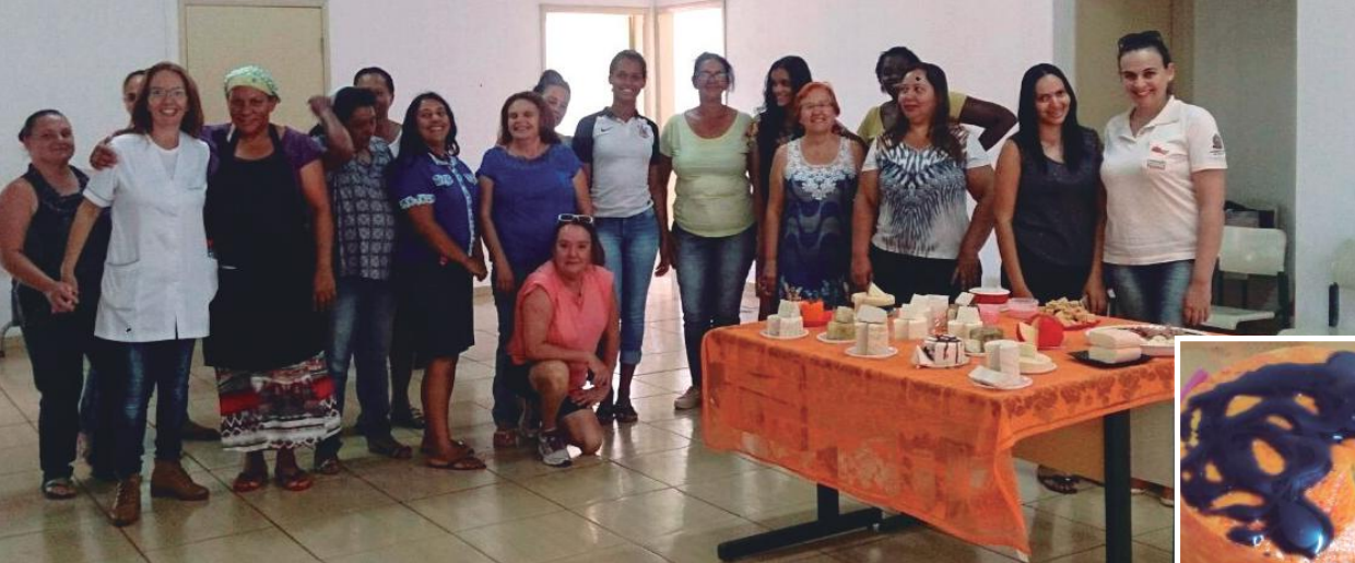
Participantes do programa no Assentamento Monte Alegre II