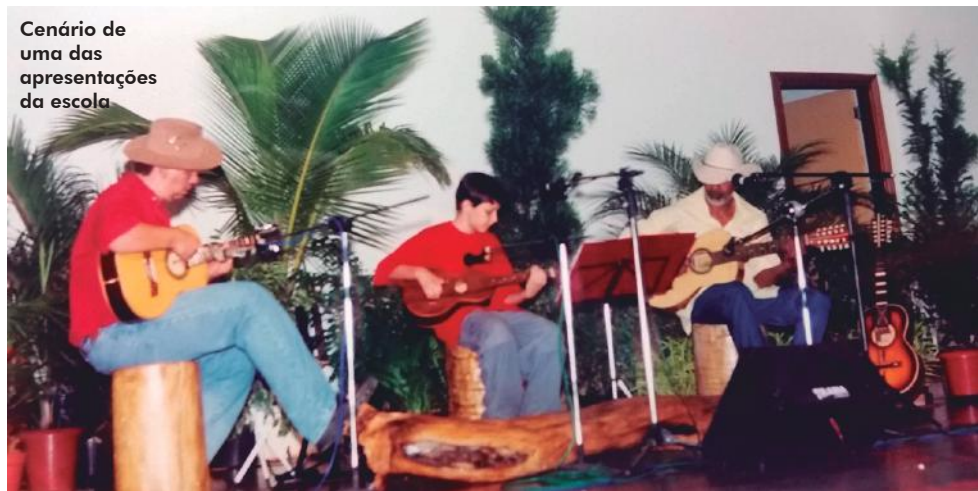
Cenário de uma das apresentações da escola

Na época, com dificuldades de acesso aos discos e métodos, ele sentava com o seu instrumento e ouvia programas das rádios Nacional e Record, tirava as modas de Tonico e Tinoco, Zico e Zeca, Vieira e Vierinha até conhecer o revolucionário pagode de Tião Carreiro e Pardino.