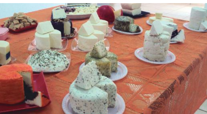
Produtoras em pequenas propriedades aprenderam a trabalhar com o derivado do leite e já podem preparar deliciosos produtos no âmbito familiar