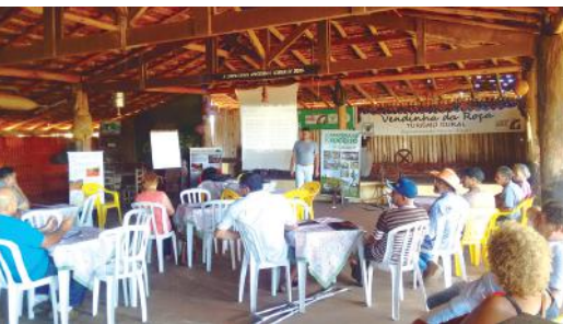
Aula teórica sobre técnicas de podas na Fruticultura

Nos dias 20 e 21 de fevereiro, os produtores tiveram a oportunidade de aprender na prática a poda de diversas frutíferas, a fim de otimizar a produtividade e aproveitamento comercial dos frutos, que são comercializados pelos produtores participantes nas feiras de Araraquara e Matão.