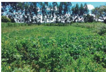
Área de adubação verde onde serão plantados os tomateiros