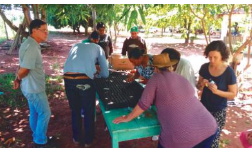
Produtores aprendem semear os tomateiros para a formação das mudas