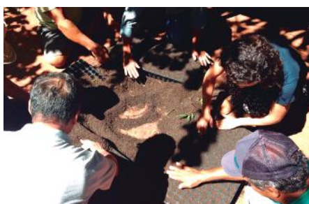
Grupo desenvolve etapa de semeadura do tomate nas bandejas