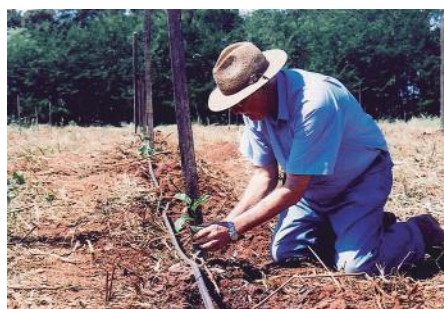
Intimidade com a terra e o interesse em plantar o maracujá seguindo novas técnicas