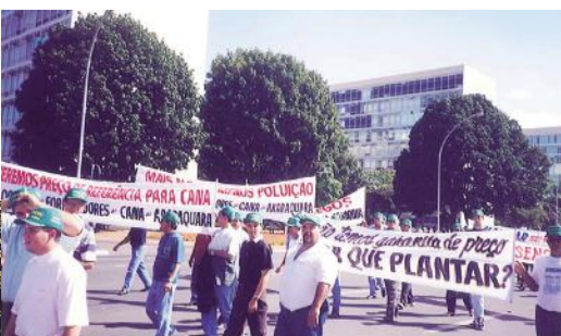
Baú em Brasília com colegas canavieiros por preços mais justos para a cana-de-açúcar

Este relacionamento no mundo dos negócios é o que o levou a colecionar a Revista Globo Rural desde 1985 e cuja coleção é guardada por ele com muito carinho pois trata-se de uma importante fonte de consulta. “Nas horas de folga dou uma ‘folheada’ nas revistas acompanhando a transformação dos tempos”, comenta o produtor.