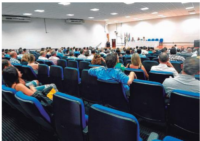
Auditório da Fatec em Jaú sediou o encontro dos prefeitos e representantes de sindicatos rurais da nossa região

demos ver que houve o reconhecimento dos prefeitos e dos representantes dos sindicatos que compreenderam o peso e o quanto nossa instituição poderá contribuir com fortalecimento da Bacia Hidrográfica do Tietê-Jacaré.