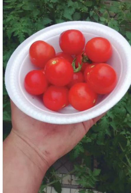
Atualmente, o Programa Tomate Orgânico é um dos mais requisitados pelos produtores face a abertura de mercado

Com acompanhamento técnico, os participantes da atividade percorrem a área onde foi plantada a adubação verde que é uma das etapas de preparo do solo e colocam as sementes de tomate nas bandejas. Além disso, neste primeiro módulo, tiveram aula teórica onde foram explorados os aspectos regionais do contexto de Araraquara.