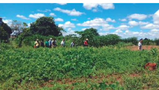
Participantes visitando área de adubação verde para preparação do solo