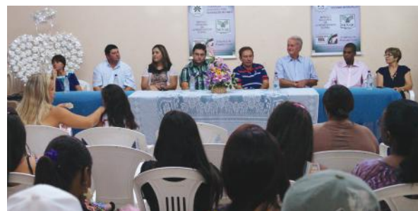
▼ Autoridades e convidados durante a solenidade de formatura, premiando através da certificação, a dedicação de cada jovem