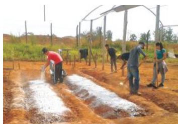
▼ Inicialmente, a preparação do solo com o acompanhamento do instrutor técnico; depois o plantio e a colheita das hortaliças pelos alunos