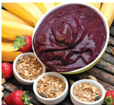
Combinação do açaí