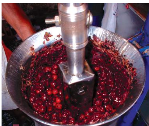
Moendo a fruta