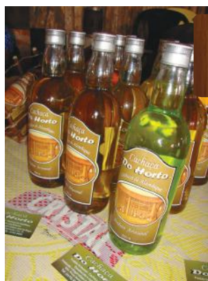
A cachaça produzida pelos assentados do Monte Alegre foi transformada em mais uma fonte de renda