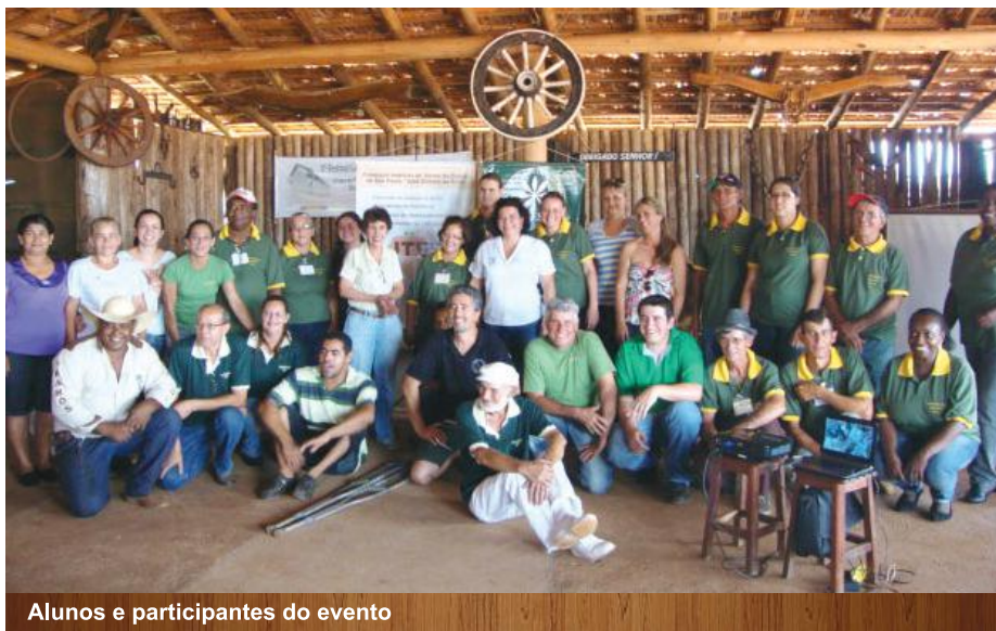
Alunos e participantes do evento

oferecer opções para o turismo rural. “Capacitar, criar condições de negócios, sempre valorizando a terra, com atrativos e adequações, com espaços e infraestrutura, aliados a uma fonte de renda e mesmo que o jovem vá para a cidade estudar será possível fixá-lo no campo”.