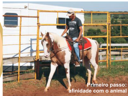
Primeiro passo: afinidade com o animal

A técnica de Rédeas é uma modalidade de competição de cavalos que acontece em várias partes do mundo. No Brasil uma das mais importantes ocorre no Congresso Brasileiro de Quarto de Milhas, onde são apresentados os melhores animais da categoria.