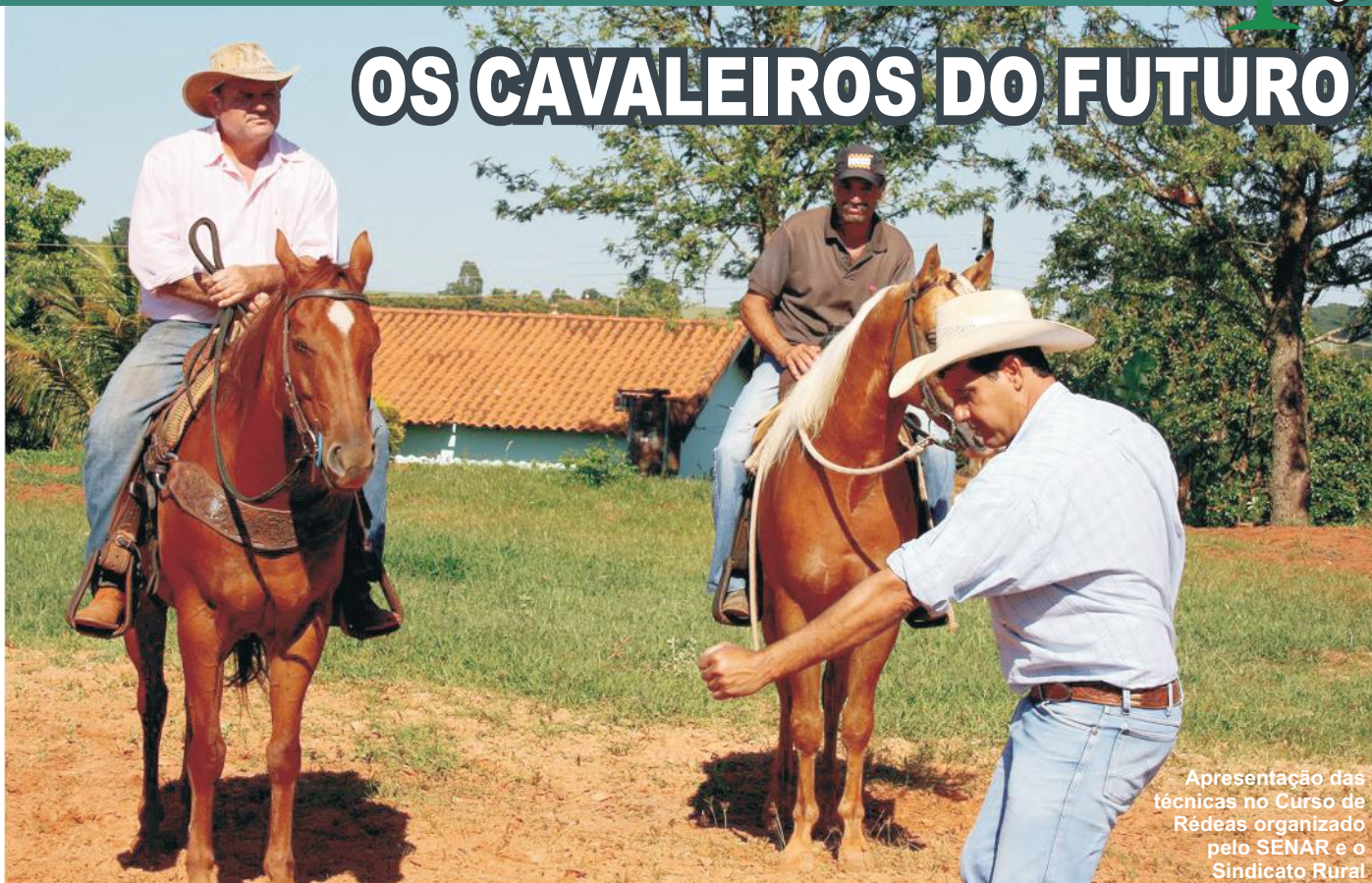
Apresentação das técnicas no Curso de Rédeas organizado pelo SENAR e o Sindicato Rural

Ação conjunta do SENAR e o Sindicato Rural tornou possível a realização de um Curso de Rédeas com o objetivo de preparar os animais para competições.